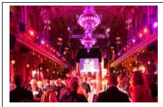
Utdelningen sker på Berns i Stockholm

I projektportalen kan anställda, kunder och leverantörer samverka och dela på information.